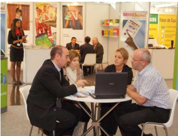
Medios de comunicación en el área de recursos humanos

Use the Personal España as an opportunity to reengage and reconnect with past clients and business acquaintances.