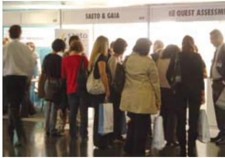
„Área común“ 4m 2