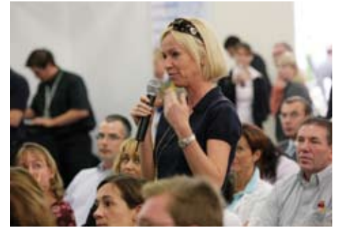
Participación activa en las presentaciones