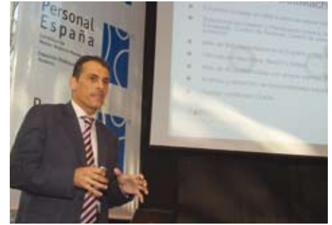
Ponente durante la conferencia