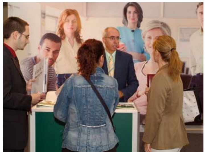
El valor del Software