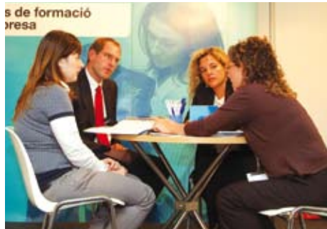
Formación en el ámbito laboral