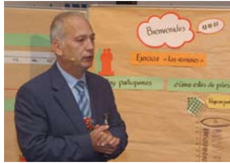
Zona de Acción „Training“