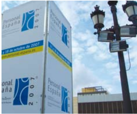
Personal España, en su 1ª Edición 2007