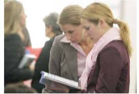
Información del catálogo de la Feria