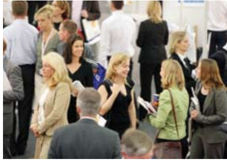
Los visitantes profesionales