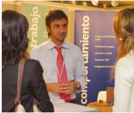
Empresas Consultoras para la gestión humana