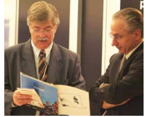
Software para los recursos humanos