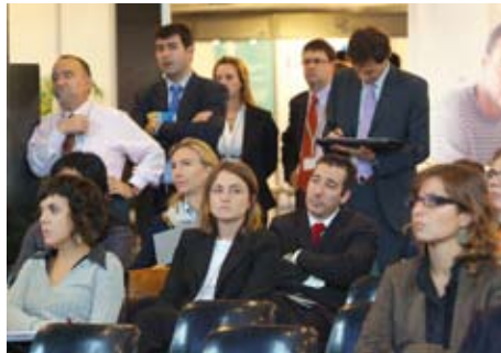
Los visitantes especializados