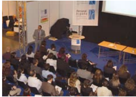
Foros de Prácticas