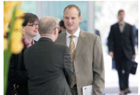
Directores de Recursos Humanos